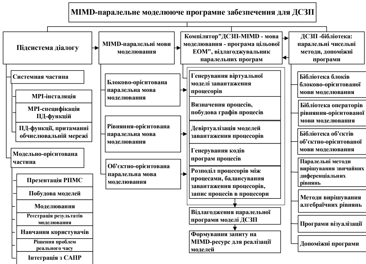
Рис. 4. Склад моделюючого програмного забезпечення MIMD-компоненти РПМС для ДСЗП

В структурах РПМС, показаних на рис. 2, 3, MIMD-компонента представлена паралельними обчислювальними системами MIMD, їх системним та моделюючим програмним забезпеченням. Доступ до