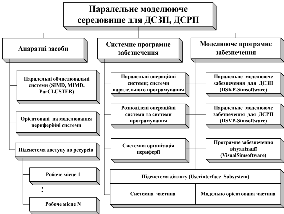
Рис. 2. Структурна організація паралельного моделюючого середовища

Передбачені структурою локальні сервери можуть мати паралельні ресурси, модельно орієнтоване периферійне обладнання та засоби побудови напівнатурних моделюючих комплексів. Структура рис. 3 реалізується в рамках функціонуючих надпотужних