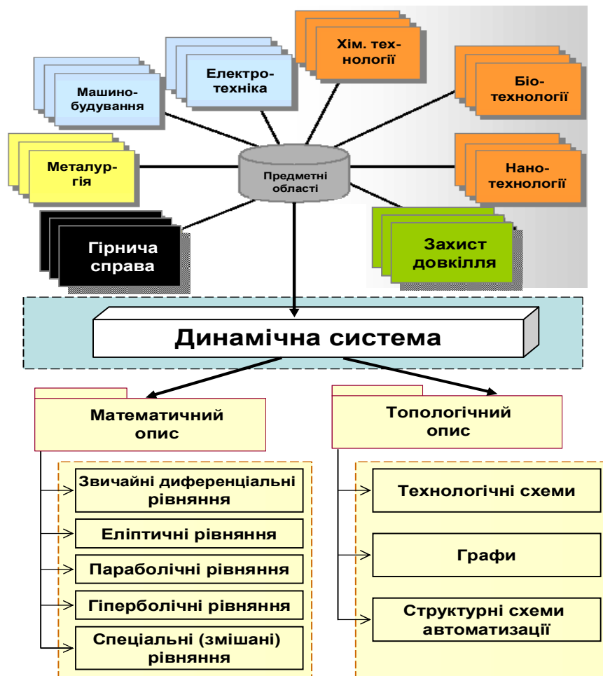
Рис. 1. Динамічні системи предметних областей та їх формальний опис

Рівень розвитку всіх сучасних предметних областей (рис. 1) від гірничої справи, металургії, хімії, машинобудування, електротехніки та енергетики, аерокосмонавтики до мікроелектроніки, медицини, біо- та нанотехнологій в вирішальній мірі визначається досягнутим рівнем знань теорій, розуміння взаємодії та інтеграції різних динамічних процесів, їх практичного втілення експертами предметних областей в СДС-проекти. Теорія динамічних систем сприяє поєднанню різноманітних предметних областей (рис. 1) при комплексному вирішенні технічних і технологічних проблем.