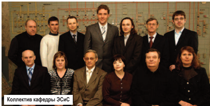
Коллектив кафедры ЭСИС