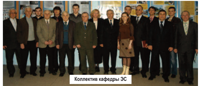
Коллектив кафедры ЭС

ли «пасут задних» и студенты ЭТФ. Многие из них являются победителями и призерами студенческих конкурсов и олимпиад различного уровня, спортивных соревнований, турниров КВН.