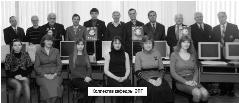
Коллектив кафедры ЭПГ

тили кандидатские диссертации, а состав факультетаполнили трое молодых преподавателей.