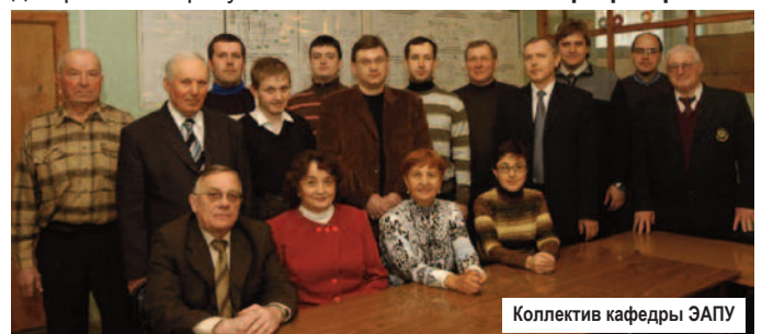
Коллектив кафедры ЭАПУ

В 2011 г., в рамках празднования 90-летия ДонНТУ, планируется проведение традиционной международной научнотехнической конференции "Управление режимами работы объектов электрических и электромеханических систем", которая способствует налаживанию и укреплению связей работников этой сферы.