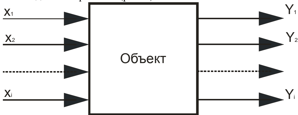
Рисунок 1 - Кибернетическая модель "черный ящик"

В инженерном эксперименте часто для объекта исследования используется модель "черного ящика", которую представляют в виде прямоугольника с выходными и входными стрелками (рис. 1).