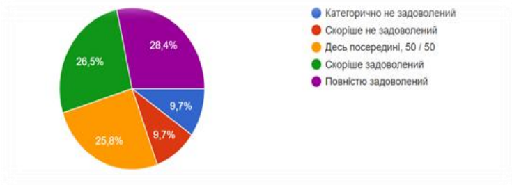
Рис.1. Задоволеність здобувачів освіти рівнем дистанційної підтримки під час карантину

Загалом, більша частина студентів повністю або скоріше задоволена технологіями дистанційного навчання, які використовуються в ДонНТУ в умовах карантину (рис.1).