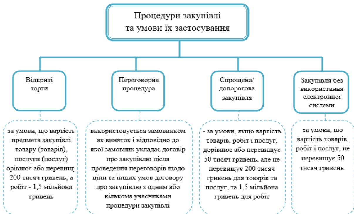
Рис.1. Процедури закупівлі та умови їх застосування

Процедури відкритих торгів, торгів з обмеженою участю та конкурентний діалог, у розумінні закону є конкурентними. Умови застосування процедур закупівель зображені на рис.1.