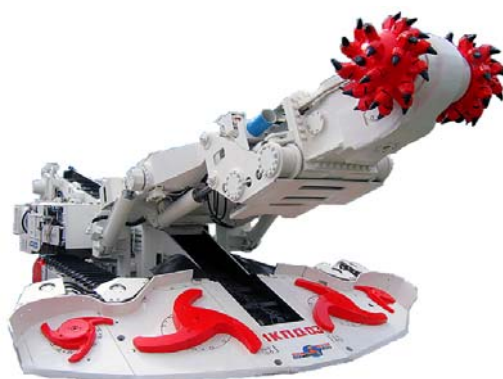
Рисунок 1 – Проходческий комбайн КПД

исполнительного органа комбайна КПД при ручном управлении его рабочим процессом. Одновременно осуществлялся хронометраж работы комбайна. Структура забоя была представлена несколькими прослойками различной крепости: песчаник серый, уголь, сланец песчано-глинистый и алевролит аргиллистый. Выработка сечением 13 \text{ м}^2 крепилась арочной крепью с шагом 0.8 \text{ м} . Суточный режим работы забоя составлял три рабочие смены по 6 часов и одна ремонтная. Измерения тока двигателя приводов исполнительного органа проводились посредством блока регистрации произошедших событий – многоканального анализатора TOPAS1020. За период проведения эксперимента комбайном было пройдено 15.2 \text{ м}^2 выработки.