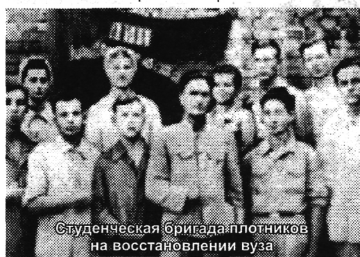
Студенческая бригада плотников на восстановлении вуза